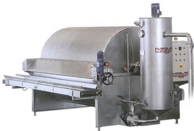
Фильтр FRP 8