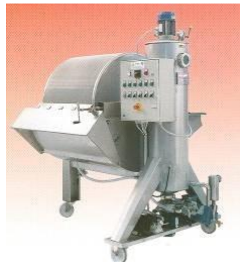
Фильтр FRP 2,5

С коробкой, соответствующей нормам ЕС; в сборе с главным выключателем, кнопками включения / выключения, сигналами тревоги, лампочками, сигнальными лампочками и выключателями дистанционного управления для каждой установленной мощности. 400 В/3/50 Гц.